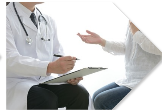
3.問診所 接種前の体調チェック