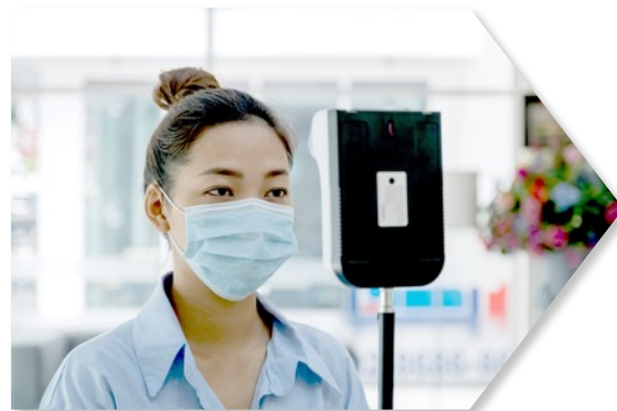
1.入場検温所 来場者全てに検温・消毒