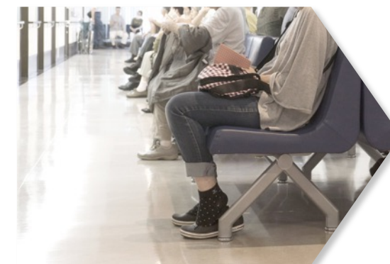
5.待機所 接種後の経過観察