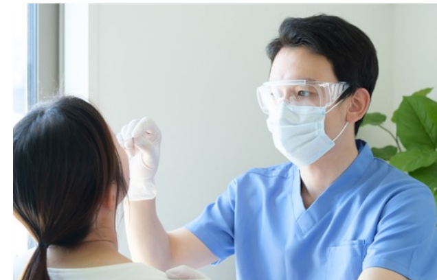
PCR検査エリア 陽性の可能性がある来場者向けの対応