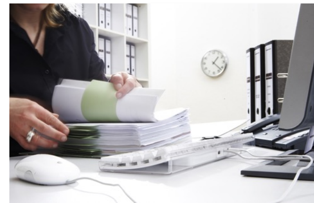
運営事務局控室 運営関係者の待機・休憩所・打合せの場として