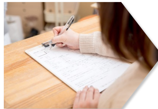
2.受付 名簿チェック