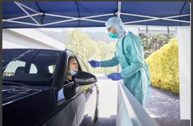
#検査時のイメージ