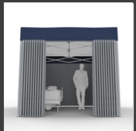
#正面・内部イメージ