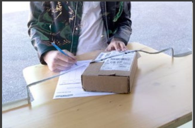
#品物受渡イメージ