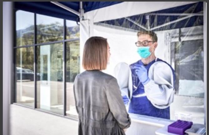
#検査時のイメージ